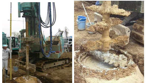
写真-1 施工機械 写真-2 施工完了状況

注) 気泡: 合成界面活性剤系の起泡剤を、水で希釈して発泡装置を用いて、体積を約500倍に発泡させた。 気泡添加率: 土に気泡を添加するとき指標で、土の乾燥重量に対する起泡剤の重量比率(%)で表す。 気泡注入量: 気泡を土砂に注入する量の指標。掘削土体積1m 3 に対して注入する気泡量(ℓ/m 3 )。