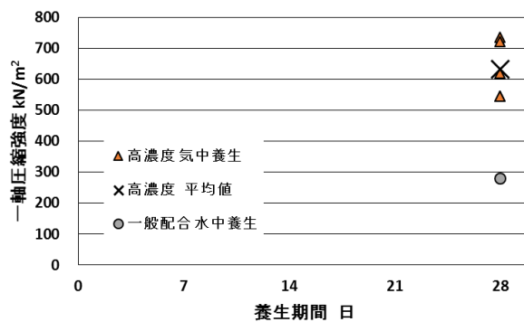
図 3.1 一軸圧縮試験結果